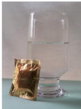
Situação 1: Comprimido com a embalagem, fora do copo com água.

Ilustração para dinâmica Fé em Ação! http://ministerio-c-adolescentes.blogspot.com.br/