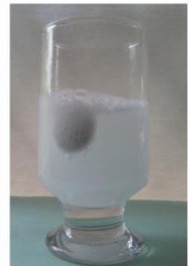
Situação 3: Comprimido sem a embalagem, dentro do copo com água.