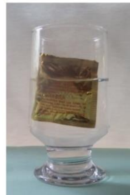
Situação 2: Comprimido dentro do copo com água, mas com a embalagem.